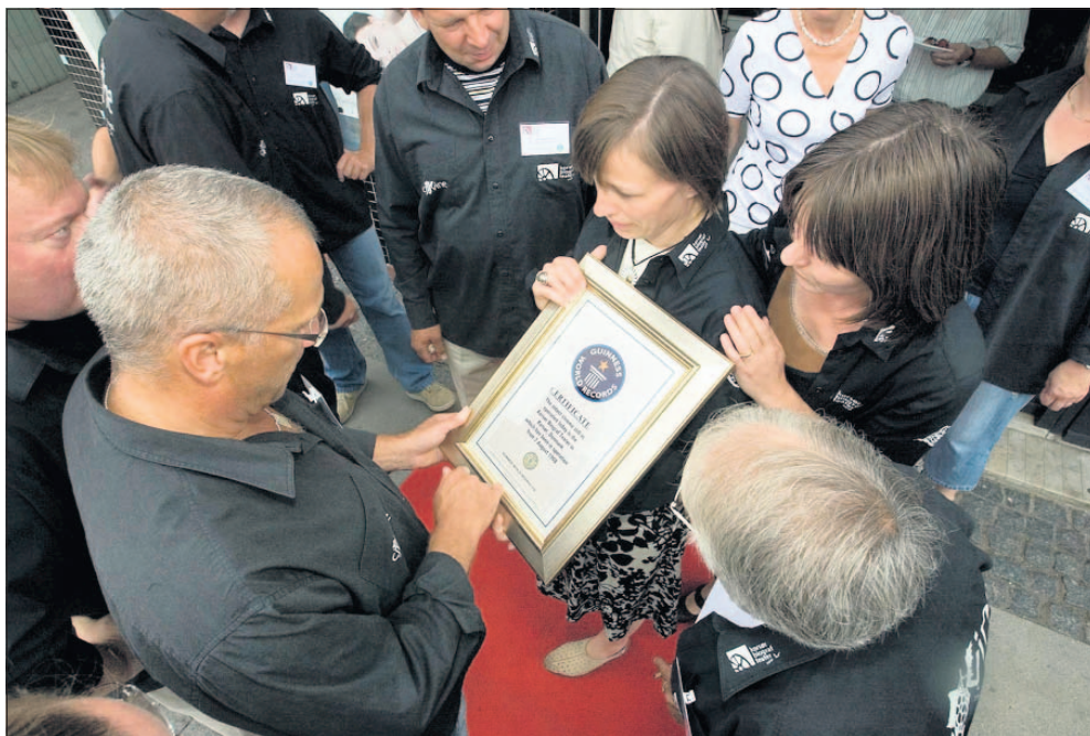
Guinness Rekordbog havde indtil 2008 registreret biografen Kino Pionier i Stettin i Polen som den ældste, men den er knap et år yngre end biografen i Korsør. Derfor blev Korsør Biograf Teater optaget i rekordbogen som verdens ældste i august 2008.