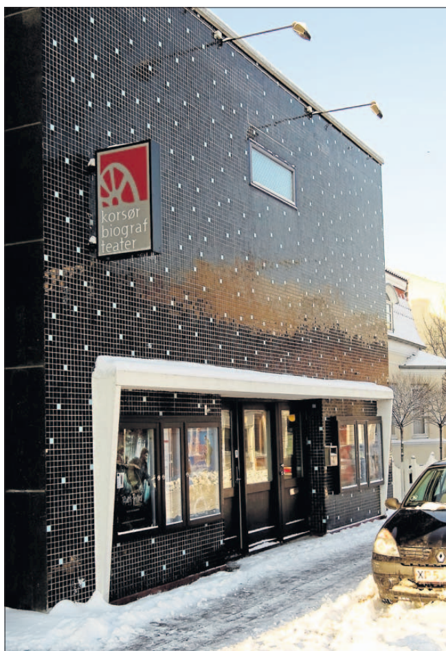
Korsør Biograf Teater er verdens ældste biograf, og den åbnede på Jens Baggesens Gade i Korsør den 7. august 1908.

Bag biografen står mindst 35 frivillige, der vil gøre, hvad de kan for at bevare den gamle biograf - de står for alt lige fra at passe kiosken, sælge billetter, bestille film hjem og til at ordne det administrative. Formanden for Korsør Bios Venner, der